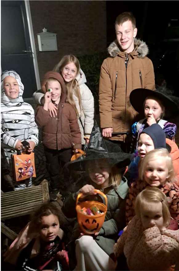
Tekst en fotografie Wiekie

Diegene die deze optocht georganiseerd hebben wil ik graag namens de kinderen bedanken. Ik kijk nu alweer uit naar volgend jaar want dan is het de bedoeling om het nog grootser aan te pakken, aldus de organisatoren.