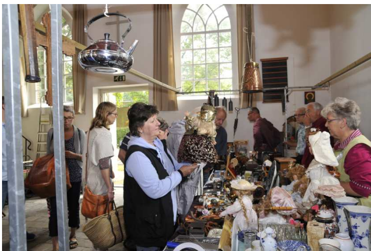
Kerkenmarkt Spankeren 2016

Hiermee is de WhatsApp-buurtpreventie eind juli in werking getreden. In het najaar (medio oktober) worden bij de toegangswegen van ons dorp meldingsborden geplaatst met de tekst dat we een actieve buurtpreventie hebben. Dit zal met enig vertoon c.q. een kleine festiviteit gebeuren. In het najaar wordt er onder leiding van de politie ook een buurtpreventieoefening georganiseerd. De WhatsApp-deelnemers worden hierover rechtstreeks benaderd. De andere Spankerenaren worden hierover tijdig geïnformeerd via onze webpagina www.belangenverenigingspankeren.nl en via de Regiobode.