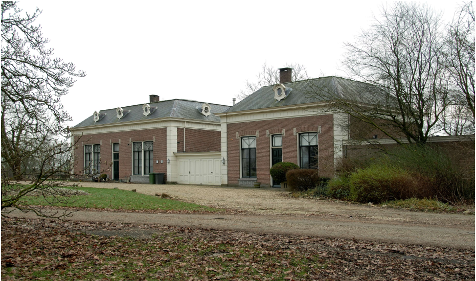
Gebouw links is de oranjerie

te geven. Daar moest de vloer tegen bestand zijn en deze werd daarom gemaakt van gele, harde IJsselsteentjes. Onder de vloer lagen verwarmingsbuizen. Door een aantal gietijzeren roosters in de vloer kan warme lucht opstijgen.