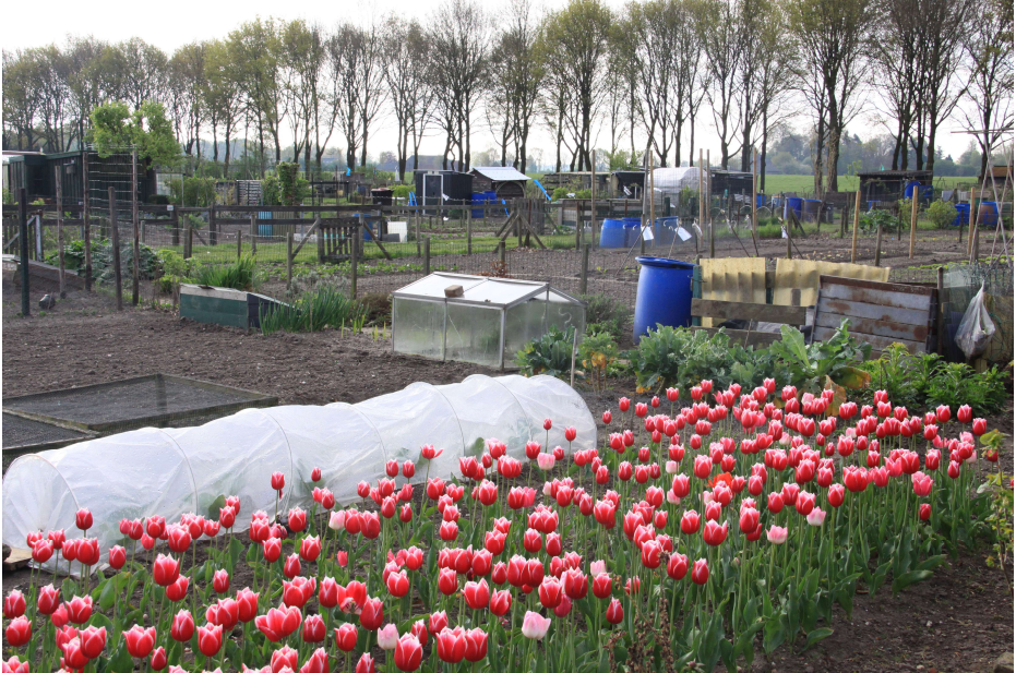
Volkstuincomplex Kerkweg 8